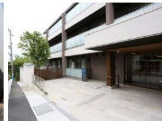
グランフォレスト神戸御影